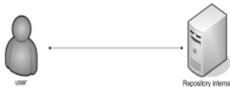
Gambar 2. Akses Menu Repositori

internal. Pada Gambar 1 diperlihatkan pengguna melakukan query ke repository internal untuk mencari data jurnal atau artikel berdasarkan kata kunci yang dimasukkan dalam form HTML. Pengelolaan informasi pada sistem perpustakaan digital UIN Bandung meliputi pencarian kata kunci berdasarkan tahun, subjek yang dicari yaitu judul karya ilmiah, Divisi subjek yaitu berdasarkan fakultas yang terdiri dari beberapa program studi dan kata kunci nama penulis karya ilmiah.