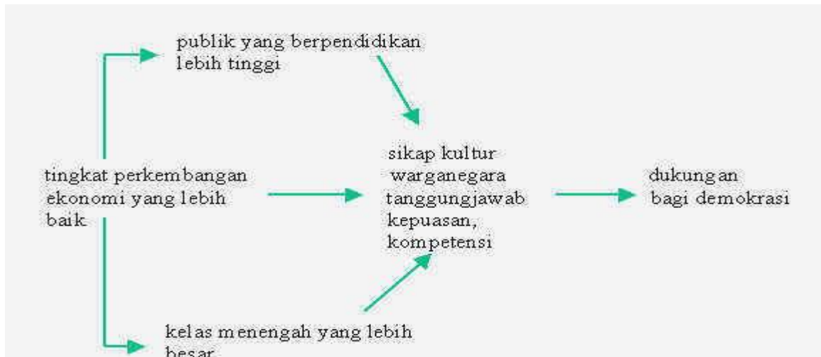
Gambar 1. Perkembangan Ekonomi Sebagai Sebuah Faktor Dalam Demokratisasi

Berkaitan dengan hubungan pendidikan dan perkembangan ekonomi ini, Edgar Faure pada makalahnya tentang "Pendidikan dan Hari Depan Umat Manusia" 7 menegaskan bahwa kecepatan perkembangan pendidikan dan pengajaran selalu selaras dengan kecepatan langkah perkembangan ekonomi. Jika ekonomi berkembang cepat, maka pendidikan pun cenderung cepat mengembangkan pengetahuan guna menyiapkan tenaga-tenaga yang dibutuhkan pada bidang pembangunan ekonomi.