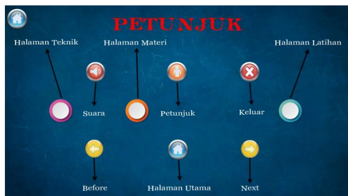
الصورة 4: صفحة توجيهات استخدام برنامج أندرويد

يتضمن هذه الصفحة على إرشادات وتوجيهات استخدام هذا البرنامج. واستخدام هذا البرنامج لمعرفة الصمامات والتوجيهات لدى الطلبة.