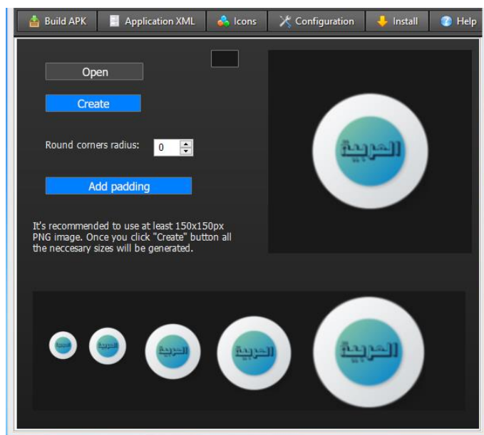
الصورة 5: تحويل المادة إلى برنامج أندرويد