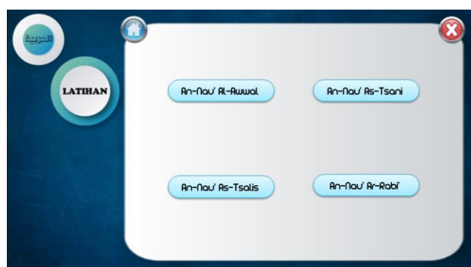
الصورة 1: الصفحة الأولى للمواد

تتضمن هذه الصفحة على الأسس الرئيسية في البرنامج يعنى مجموعة من صمامات البرنامج التي بضغطها تسير إلى الصفحة المرجوة. هذه هي صورة الصفحة.