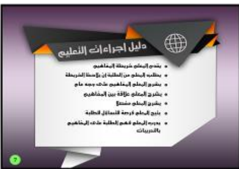
الصور رقم ٣: إجراءات تعليم الصرف بخريطة المفاهيم