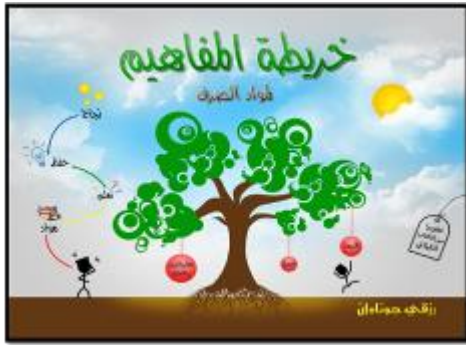
الصورة رقم ٢: الغلاف القدام