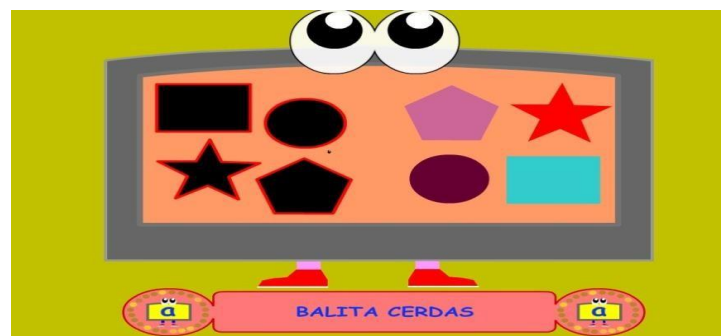
Gambar 4.13 Mencocokkan Bermain Puzzle

Gambar diatas adalah permainan puzzle, dengan mencocokkan gambar danmen drag diatas sesuai dengan bentuk-bentuk nya, contoh segi tiga warna kuning dicocokkan dengan segitiga warna ungu dan seterusnya baru berhasil