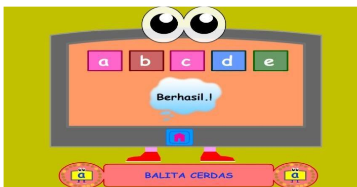
Gambar 4.16 Pintar Menyocokkan Huruf

Gambar diatas adalah mengurutkan huruf sesuai abjad dengan cara mengisi kolom-kolom kosong dengan mendrag jawaban ke kolom yang disediakan, jika jawaban benar akan keluar tulisan berhasil