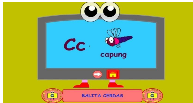
Gambar 4.5 Pengenalan Huruf

Pada saat tombol di atas diklik maka akan masuk ke menu pengenalan huruf seterusnya, Contoh gambar diatas : Huruf B disebelahnya Gambar Buku