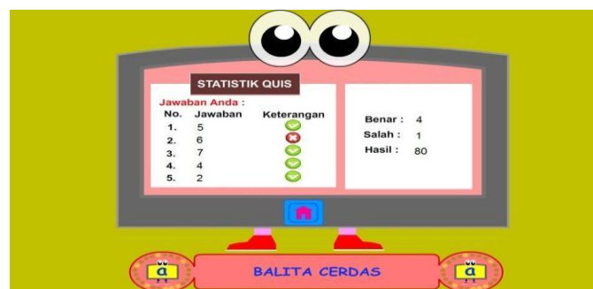
Gambar 4.22 Menu Cek Jawaban.

Menampilkan hasil koreksi pengerjaan soal.