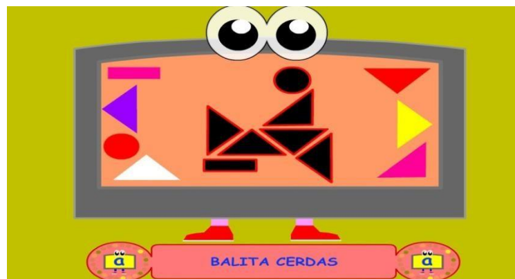
Gambar 4.11 Pintar Bermain puzzle

Disini anak dilatih untuk pintar bermain puzzle, mencocokkan gambar dan mendrag jawaban yang sesuai ke bentuk-bentuk yang telah disediakan, jika jawaban benar maka akan keluar tulisan berhasil dan tombol next.