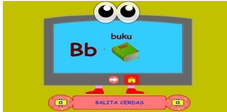
Gambar 4.4 Contoh Huruf A

Pada saat tombol di atas diklik maka akan masuk ke menu pengenalan huruf seterusnya, Contoh gambar diatas : Huruf B disebelahnya Gambar Buku