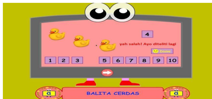
Gambar 4.18 Pintar Berhitung

Pada menu itu terdapat 5 soal, anak dilatih untuk berhitung, menghitung jumlah gambar dan mendrag jawaban ke kolom yang telah disediakan, jika jawaban benar akan keluar tulisan Kamu Pintar, Luar Biasa! Dan tombol next, jika jawabannya salah akan keluar tulisan Yah Salah! Ayo Diteliti Lagi. Dan keluar tombol telitibertuliskan disini untuk mengetahui jawaban yang benar dan tombol next. Disoalkelima akan ada tombol cek jawaban untuk mengetahui hasil koreksi jawaban.