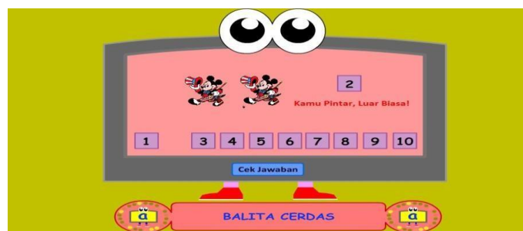
Gambar 4.20 Pintar Berhitung

Gambar diatas adalah mengurutkan huruf sesuai abjad dengan cara mengisi kolom-kolom kosong dengan mendrag jawaban ke kolom yang disediakan, jika jawaban benar akan keluar tulisan berhasil