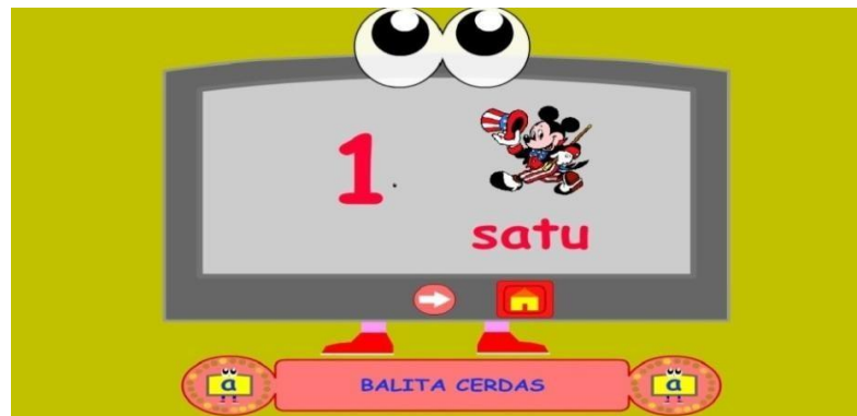
Gambar 4.7 Contoh huruf 1

Pada saat gambar panah di bawah diklik maka akan masuk ke menu pengenalan huruf Contoh gambar diatas : Huruf 1