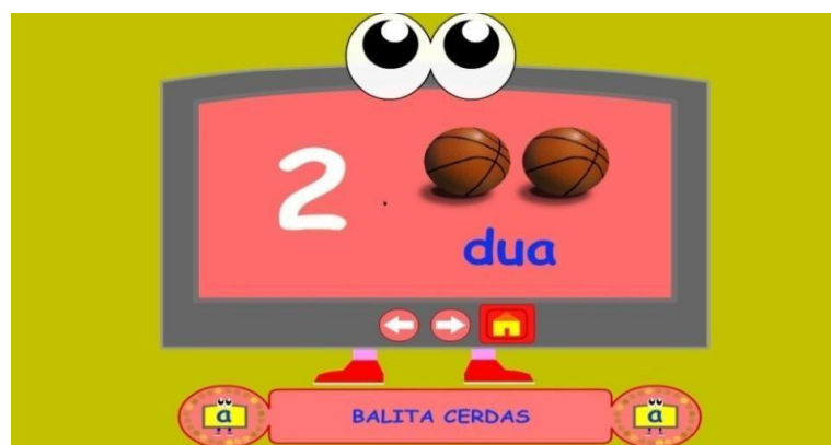
Gambar 4.8 Contoh angka 2

Pada saat gambar panah di atas diklik maka akan masuk ke menu pengenalan huruf Contoh gambar diatas : Huruf 2