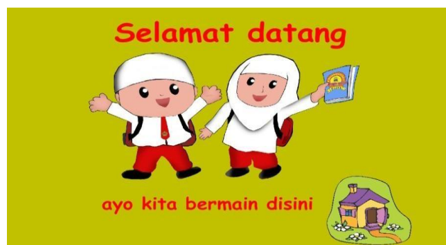
Gambar 4.1 Tampilan Awal

Pada saat pertama kali dijalankan maka akan muncul Tampilan Awal terdapat tulisan Selamat Datang dan untuk masuk ke menu utama, klik gambar rumah.