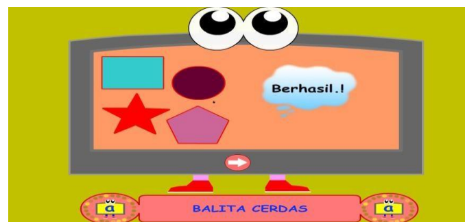
Gambar 4.14 Pintar Bermain Puzzle

Gambar diatas adalah permainan puzzle, dengan mencocokkan gambar dan mendrag diatas sesuai dengan bentuk-bentuk nya, contoh bintang warna merahdicocokkan dengan gambar bintang warna hitam dan seterusnya baru berhasil