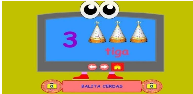
Gambar 4.9 Pengenalan Angka

Pada saat tombol di atas diklik maka akan masuk ke menu pengenalan huruf Contoh gambar diatas : Huruf 3 ada gambar 3 kerucut seterusnya Klik Panah Dibawah