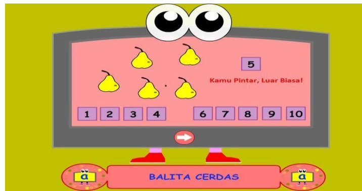
Gambar 4.17 Pintar menghitung

Pada menu itu terdapat 5 soal, anak dilatih untuk berhitung, menghitung jumlah gambar dan mendrag jawaban ke kolom yang telah disediakan, jika jawaban benar akan keluar tulisan Kamu Pintar, Luar Biasa! Dan tombol next, jika jawabannya salah akan keluar tulisan Yah Salah! Ayo Diteliti Lagi. Dan keluar tombol telitibertuliskan disini untuk mengetahui jawaban yang benar dan tombol next. Disoalkelima akan ada tombol cek jawaban untuk mengetahui hasil koreksi jawaban.