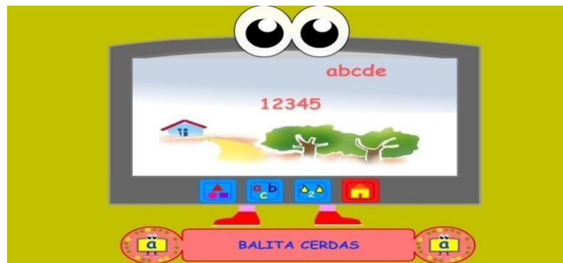
Gambar 4.10 Menu Bermain Dan Belajar

Setelah kembali ke menu utama, klik tombol puzzle untuk masuk ke menubermain dan belajar. contoh