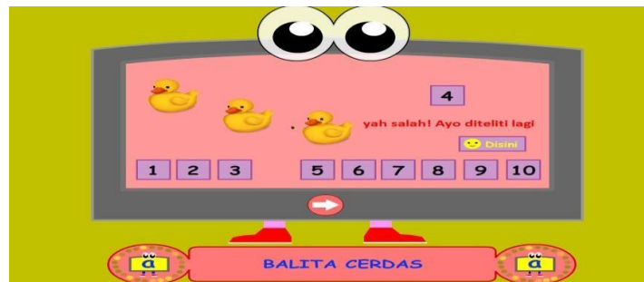
Gambar 4.19 Soal Bermain Puzzle

salah akan keluar tulisan Yah Salah! Ayo Diteliti Lagi . Dan keluar tombol teliti bertuliskan disini untuk mengetahui jawaban yang benar dan tombol next. Disoalkelima akan ada tombol cek jawaban untuk mengetahui hasil koreksi jawaban.