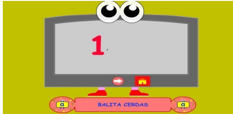
Gambar 4.6 Pengenalan Angka

Pada saat gambar panah di bawah diklik maka akan masuk ke menu pengenalan huruf Contoh gambar diatas : Huruf 1