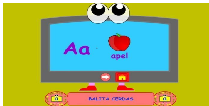
Gambar 4.3 Pengenalan Huruf

Saat tombol abc di klik maka akan masuk ke menu pengenalan huruf, huruf a sampai .