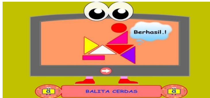
Gambar 4.12 Bermain Puzzle

Gambar diatas adalah permainan puzzle, dengan mencocokkan gambar dan mendrag diatas sesuai dengan bentuk-bentuk nya.