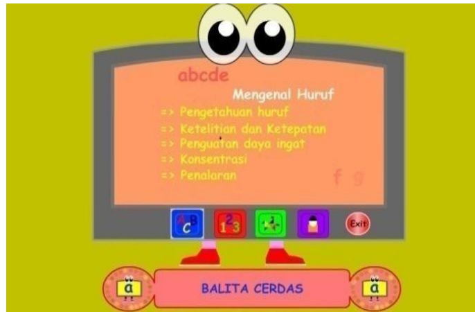
Gambar 4.2 Menu Utama Media Interaktif