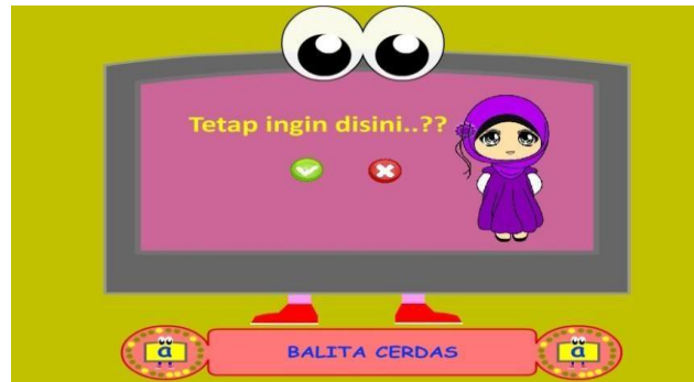
Gambar 4.24 Exit.