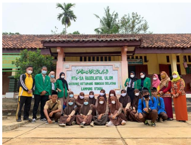
Gambar 2 Foto kegiatan PKM

Kegiatan ini diakhiri dengan mengisi kuisioner, tanya jawab, dan penanaman bibit cincau secara bergantian pada santri. Hasil sebelum pemaparan materi tingkat pengetahuan para santri sekitar 50% setelah pemaparan materi dan hasil kuisioner serta tanya jawab para santri sudah memahami materi penyuluhan sekitar 90% daripada sebelum dilakukan pemaparan materi. Semoga dengan adanya kegiatan ini para santri dan guru termotivasi untuk terus menambah wawasan mereka tentang tanaman-tanaman yang ada di Indonesia terutama tanaman yang berfungsi sebagai obat maupun mempunyai beragam manfaat untuk tubuh.