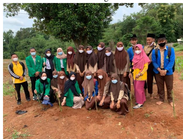
Gambar 3 Foto kegiatan PKM