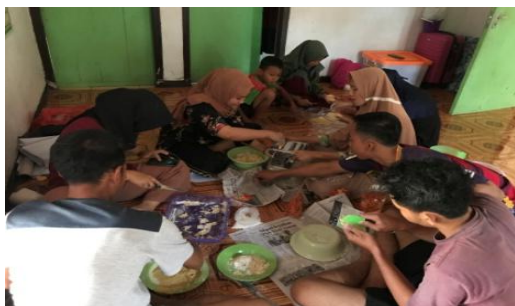
Gambar 1. Proses Pembuatan Keripik Jagung

jagung yang sudah dipipil, 4) menyiapkan bahan-bahan lainnya yang diperlukan seperti tepung terigu, tepung sagu, garam, telur (dikocok lepas), margarin, dan baking powder, 5) mencampurkan semua bahan hingga adonan kalis, 6) memipihkan sedikit demi sedikit adonan dengan alat penggiling adonan, lalu memotong adonan sesuai selera, 7) memanaskan wajan dengan api sedang lalu masukkan satu persatu adonan keripik jagung, 8) selanjutnya meniriskan keripik jagung yang sudah setengah matang, 9) setelah kering, memberi bumbu pada keripik jagung atau memberikan rasa sesuai selera, 10) kemudian mengemas kelapa yang telah diberi rasa ke dalam kemasan. Adapun proses pembuatan keripik jagung terdapat pada Gambar 1, sedangkan hasil produk keripik jagung yang sudah dikemas terdapat pada Gambar 2.