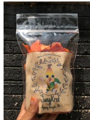
Gambar 2. Hasil Produk Keripik Jagung dalam Kemasan