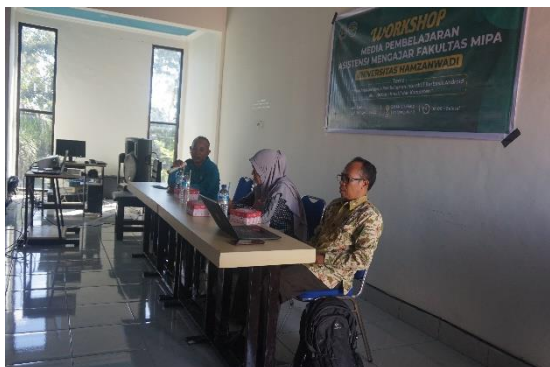
Gambar 2. Pembukaan dan sambutan oleh kepala sekolah

Kepala sekolah membuka kegiatan workshop sekaligus memberikan sambutan. Dalam sambutannya kepala sekolah mengharapkan dan menginstruksikan kepada peserta untuk terus meningkatkan kompetensi mereka di bidang teknologi mengingat tuntutan pembelajaran abad 21 dan pengimplementasian kurikulum merdeka yang saat ini sedang dijalankan oleh SMAN 2 Selong.