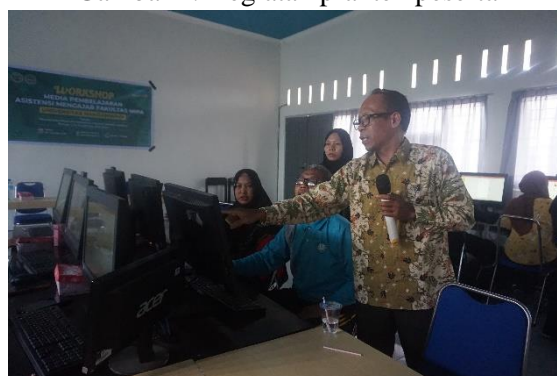
Gambar 5. Pendampingan praktek

Pada kegiatan praktik dan pendampingan praktik, peserta dapat menanyakan permasalahan yang dialami pada saat mendesain media pembelajaran berbasis android.