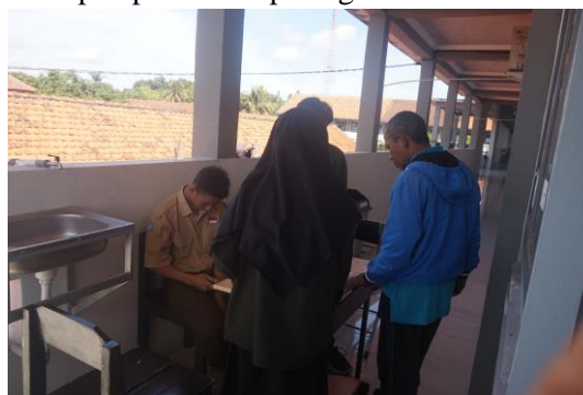
Gambar 1. Registrasi peserta workshop

Sebagaimana pemaparan pemateri dan kepala sekolah saat sambutan tentang pentingnya media pembelajaran dalam mengimplementasikan kurikulum merdeka seperti saat ini, lebih-lebih sebagian besar guru mengalami kesulitan dalam proses pembelajaran pada masa pandemic covid-19 beberapa tahun yang lalu, dikarenakan guru belum mampu mendesain media pembelajaran berbasis android. Hal ini lah yang membuat peserta termotivasi untuk mengembangkan diri dan meningkatkan kompetensi mereka dalam mendesain berbagai media pembelajaran yang dapat memudahkan guru dalam mengajar. Dengan melihat motivasi guru dalam mengikuti kegiatan ini tim pengabdian menjadi optimal bahwa kegiatan ini akan berhasil dan berlanjut untuk memberikan pendampingan sehingga peserta memahami dan dapat membuat media pembelajaran berbasis android. Pada pukul 12.00-13.30 Wita sesi istirahat sholat dan makan siang. Kemudian dilanjutkan lagi pada pukul 13.30-16.00 Wita yakni praktik lanjutan desain media pembelajaran berbasis android. Hasil dari pelaksanaan kegiatan workshop memberikan gambaran bahwa peserta telah memahami dan mampu membuat media pembelajaran berbasis android walaupun masih sederhana. Kegiatan workshop dapat dilihat pada gambar di bawah ini: