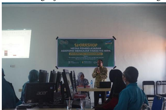
Gambar 3. Penyampaian materi

Kepala sekolah membuka kegiatan workshop sekaligus memberikan sambutan. Dalam sambutannya kepala sekolah mengharapkan dan menginstruksikan kepada peserta untuk terus meningkatkan kompetensi mereka di bidang teknologi mengingat tuntutan pembelajaran abad 21 dan pengimplementasian kurikulum merdeka yang saat ini sedang dijalankan oleh SMAN 2 Selong.