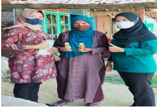
Gambar 3: Foto Kegiatan PKM

hipertensi dalam menurunkan hipertensi di keluarga dimasa pandemi Covid-19 Di Desa Binaan Jomblang Kec. Jepon Kab. Blora.