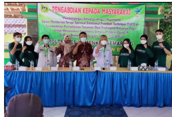
Gambar 1: Foto Kegiatan PKM

Dalam meningkatkan kapasitas kader melalui Manajemen Risiko Bencana Berbasis Komunitas, maka perlu pelibatan secara aktif para kader dalam mencegah, menanggulangi morbiditas dan mortalitas saat bencana Pandemi Covid-19, kegiatan ini dapat meningkatkan kesadaran masyarakat dan peran aktif dalam membantu pemerintah mencegah dan mengendalikan PTM hipertensi dikeluarga dimasa Pandemi Covid-19 di lingkup desa atau kelurahan.