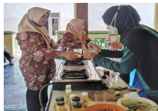
Gambar 2: Foto Kegiatan PKM