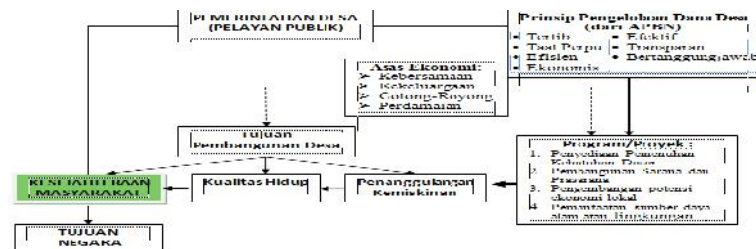
Alur Implementor Pemerintahan Desa untuk Tujuan Negara

Dana desa dikelola secara tertib, taat terhadap ketentuan peraturan perundang-undangan, efisien, ekonomis, efektif, transparan dan bertanggungjawab, dengan memperhatikan rasa keadilan dan kepatutan serta mengutamakan kepentingan masyarakat setempat. Untuk mengetahui pengelolaan atau pelaksanaan tersebut, maka penting diperlukan pengamatan dan perhatian dalam proses implementasi sampai evaluasi guna mengetahui gambaran praktis-empiris dan juga untuk menggambarkan berbagai faktor yang dapat mempengaruhinya dalam implementasi tersebut. Sebagai harapan tersebut, maka ada beberapa hal yang sangat perlu menjadi perhatian para pengambil kebijakan tentang penguatan desa seiring dengan lahirnya Undang-undang No 6 Tahun 2014 tentang Desa yang disusul dengan PP No 43/2014 yang beberapa pasal dirubah dalam PP No 47/2015, PP No 60/2014 yang beberapa pasal telah dirubah dalam PP No 22/2015, Permendagri No 113 dan No 114 Tahun 2014, Permendes No 5/2015, Permenkeu No 93/2015, dan Peraturan Bersama Menteri (keputusan bersama) No 49/2015 (sebagai penyatuan aturan terhadap arah penguatan kapasitas pembangunan desa) dan peraturan lainnya.